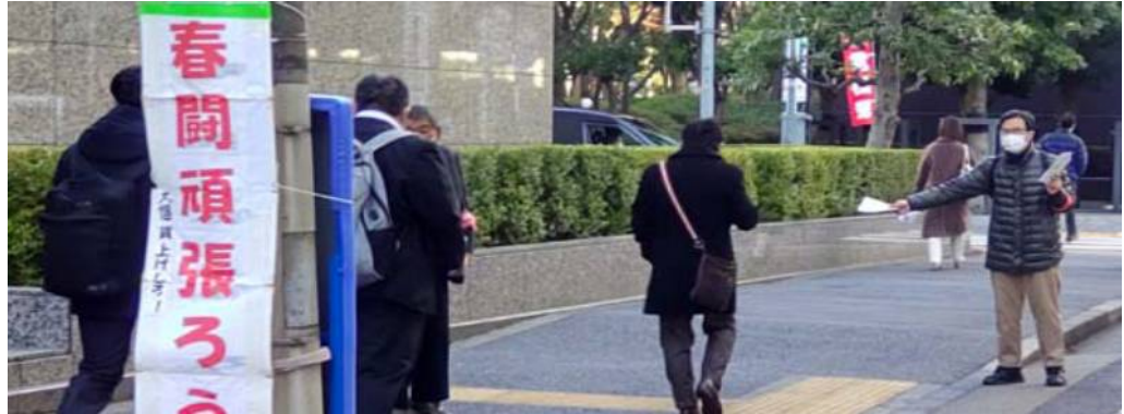
2月20日（月）NEC本社に通じる歩道で23春闘統一ピラを手渡す

電機懇は23春闘で、全国の職場の取組みを集約し、毎週「事務局情報」を発行しています。ア