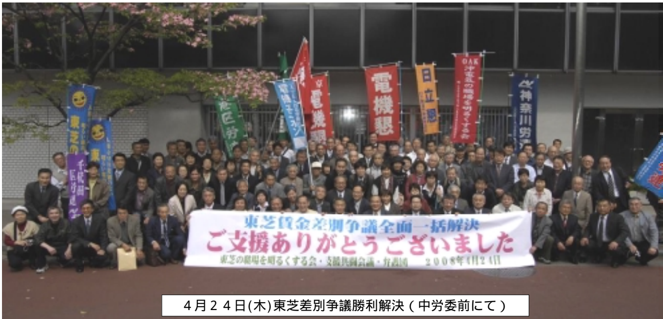
4月24日(木)東芝差別争議勝利解決(中労委前にて)